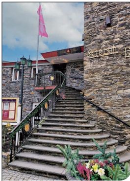
Stairway to Heaven

traminer. Das ist echt schräg, denn die Säure des Rieslings, die alkoholische Kante des Sauvignons und die Fruchtigkeit des Gewürztraminers ergeben ein önologisches Feuerwerk. Zwischen den Schlucken immer wieder diese Aussicht. Ach, Vater Rhein. Und dann probiere ich noch einen feinerherben Spätlese Riesling, einen „Azubi-Wein“ aus Oberwesel. Jahrgang 2018! Tja, irgendwie versteht man, dass der Wein noch in der Ausbildung ist, wahrscheinlich muss man den noch mal zehn Jahre liegen lassen, bis der mehr Körper kriegt. Natürlich stehen auch Weine des Weinguts Philipps-Mühle auf der Karte. Dieser Wein wird im Gründelbachtal angebaut. Von der Burg Rheinfels geht man noch nicht mal einen Kilometer weiter auf dem Rheinburgenweg ins Tal Richtung Boppard, dort liegt das Weingut. Testen kann man die Weine in der Vinothek der Philipps-Mühle gegenüber der Loreley, gut 20 Geh-Minuten vom Bahnhof in St. Goar am Rhein entlang. Adresse: An der Loreley 1A. Was will man mehr? Was kann man gastronomisch in St. Goar noch empfehlen? Auf jeden Fall das Café St. Goar , ein alter Familienbetrieb, alles Handarbeit. Klasse ist auch Aries am Rhein , das Minigolf-Café am Hafen. Tolle Atmosphäre, regionale Weine, engagierte Gastgeberinnen. Übrigens: Wer nicht zu Fuß auf dem Rheinburgenweg zur Burg Rheinfels gehen möchte, kann auch bequem mit dem Bus 681 hinfahren.