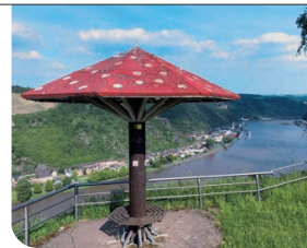
Rheinblick für Glückspilze

und dem Ort Niederburg bis zum Günderodehaus mit Blick auf Oberwesel. Oberhalb von Vater Rhein geht es dann mit vielen gigantischen Ausblicken auf die Loreley zurück in den St. Goarer Ortsteil Biebernheim. Mit dem Zuweg von St. Goar hat der Rundwanderweg eine Länge von 17 Kilometern.