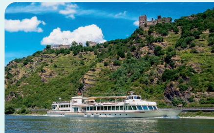
Burgen, Rhein und weiße Flotte – Romantik hoch dreif!

Nirgendwo auf seinem Weg von der Quelle in der Schweiz bis zur Mündung in Holland ist der Rhein so schön wie rund um St. Goar und Loreley. Okay, der Schaffhauser Rheinfall ist auch ganz hübsch. Aber mit dem Boot sollte man diesen gigantischen Wasserfall nicht hinunterdonnern. Dagegen ist eine Fahrt mit der Köln-Düsseldorfer auf dem Mittelrhein immer etwas Besonderes. Fun Fact: Zwischen Köln und Düsseldorf fahren keine Schiffe der Köln-Düsseldorfer. Aber es gibt Linienfahrten von St. Goar nach Boppard. Oder von St. Goar nach Oberwesel. Bei letzterer Tour haben wir einen wunderbaren Blick auf die Loreley. Von unten, aus der Frochperspektive. Eine schöne Alternative zu den Aussichten vom Restaurant der Burg Rheinfels. Selbstverständlich können wir nach der Schiffstour mit der weißen Flotte bequem mit der Bahn von Boppard oder Oberwesel zurück nach St. Goar fahren.