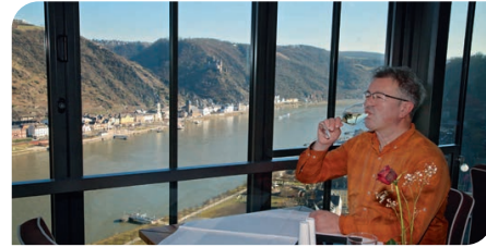
Das Auge isst (und trinkt) mit

Das Auge isst mit. Besonders im Restaurant auf Burg Rheinfels . Egal, was sie dort essen, trinken, genießen – dabei müssen Sie sich natürlich schon ein wenig konzentrieren. Sonst verfehlt die Gabel oder das Weinglas den Mund. Hinterlässt keinen guten Eindruck. Aber die Gefahr, durch das Rheinpanorama abgelenkt zu werden, ist sehr sehr groß. Die Terrasse des Restaurants auf Burg Rheinfels bietet gigantische Rhein-Panorama-Blicke von Burg Katz bis Burg Maus. Und wenn man schon die schönsten Aussichten auf den Mittelrhein genießt, sollte man den Mittelrhein auch im Glas haben. In einem der kleinsten Anbaugebiete Deutschlands sind hervorragende Weingüter beheimatet. Einige der besten Tropfen sind auf der Burg trinkbar. Ich teste zunächst zum Salat eine Cuvée von Sauvignon, Riesling und – Tuschl – Gewürz-